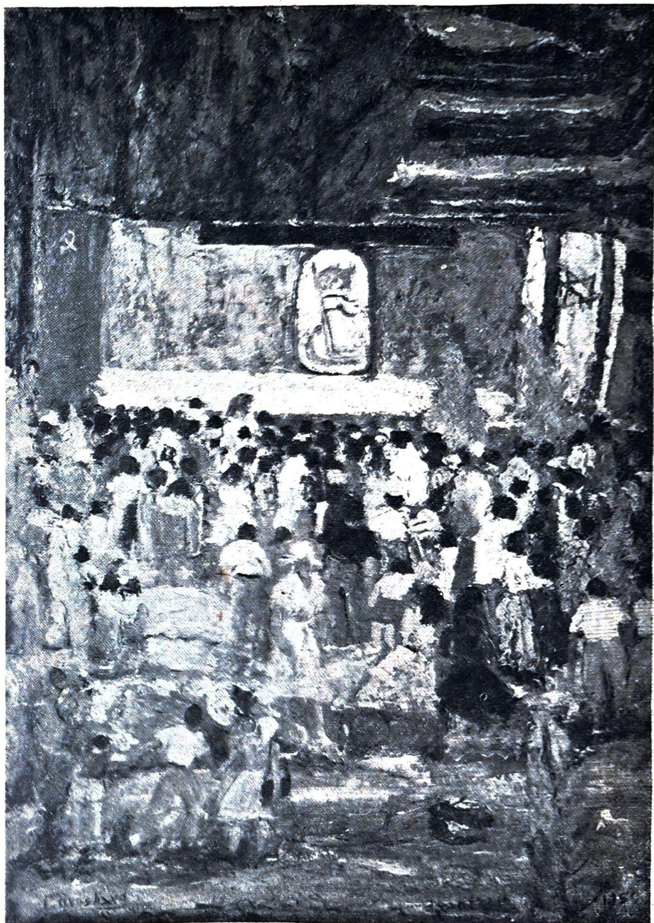
אל עצרת לכבוד הנצחון על הפאשיזם